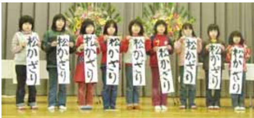
小学校三年 「松かざり」