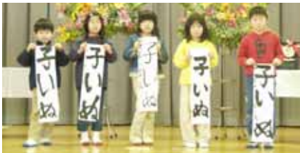
小学校一年 「子いぬ」