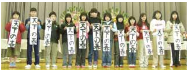
小学校五年 「天下の春」