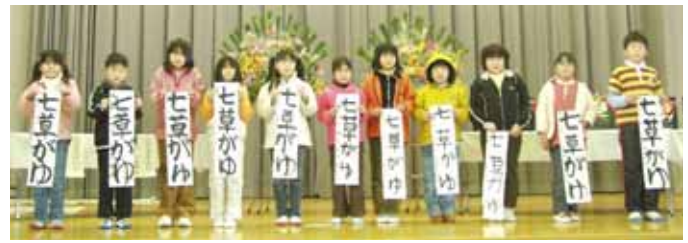
小学校四年 「七草がゆ」