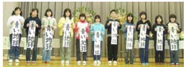
小学校六年 「青い地球」