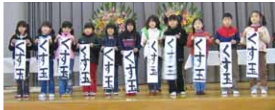
小学校二年 「くす玉」