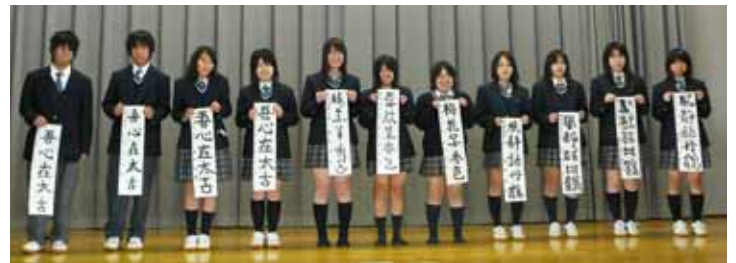
高校一年 「吾心在太古」