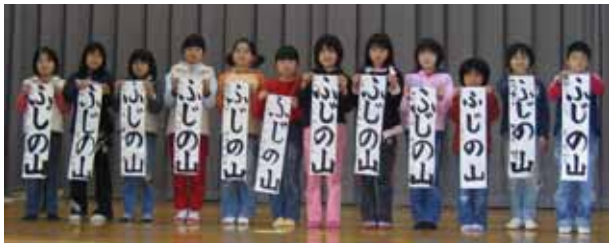
小学三年 「ふじの山」