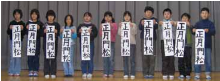
小学五年 「正月門松」