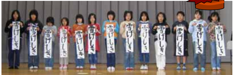
小学四年 「雪げしき」