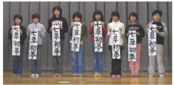
小学六年 「七草初夢」