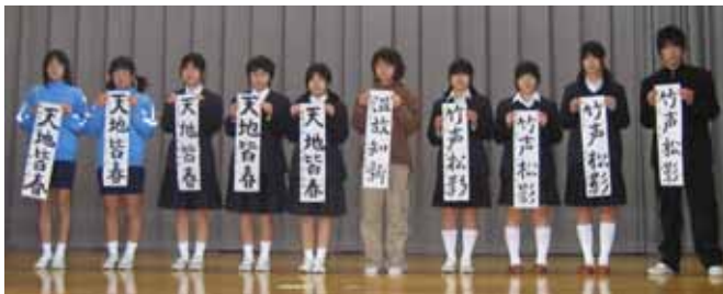
中学一年 「天地皆春」