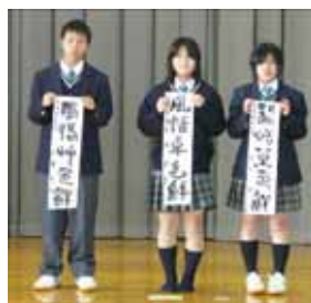
高校一年 「風恬草色鮮」