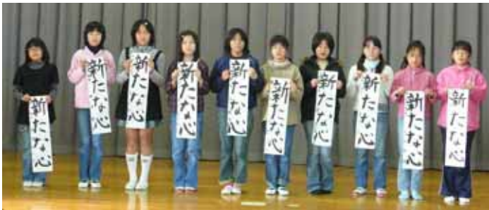
小学五年 「新たな心」