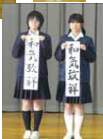
中学三年 「和気致祥」