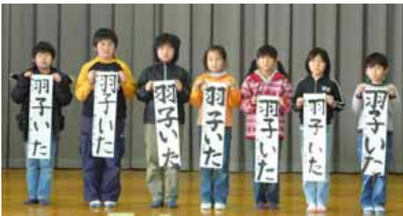
小学三年 「羽子いた」