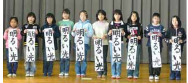
小学四年 「明るい光」