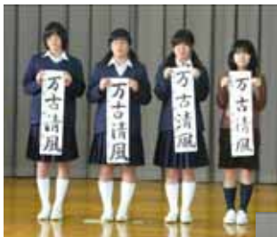
中学二年 「万古清風」