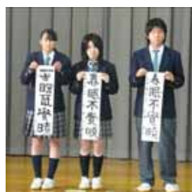
高校二年 「春眠不觉晓」