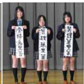
高校三年 「登楼万里春」