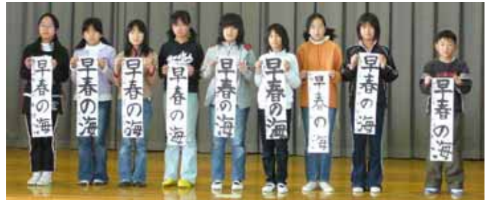
小学六年 「早春の海」