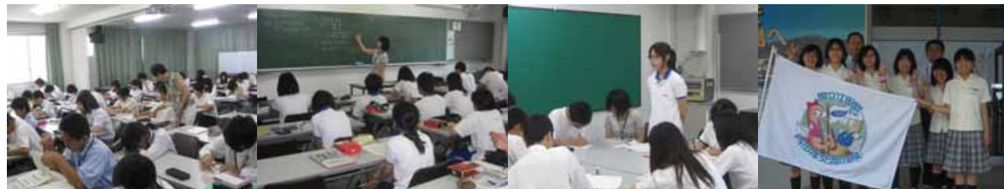
他校の生徒と交流を深めながら主体的に学習に励み、充実した三日間を過ごしました。

2年生6名の生徒が、国立江田島青少年交流の家で行われた合同学習合宿に参加しました。本校は、県の学力向上支援事業『ステップアップハイスクール』の指定を受けており、その事業の一環として行われたものです。また、今年は、本校がその幹事校を務めております。合宿では、県内19校の生徒が学校の枠組みを超えて、互いに切磋琢磨しながら学習に励みました。