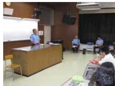
講義やVTRを通して自分たちの身を守る方法を真剣に学びました。

竹原警察署木江分庁舎の署員の方をお招きして防犯教室を開きました。講義では自転車事故の防止や違法ドラッグに対する心得などについて話していただきました。また、VTRで万引きや恐喝事件などといった青少年犯罪の現状について確認しました。生徒たちは皆、真剣に講義に耳を傾け、犯罪や事故から身を守る方法を学びました。