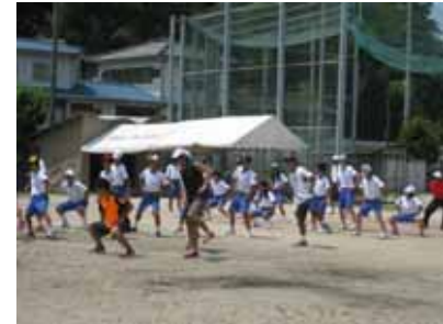
中学生たちの手本となれるよう真剣に練習に取り組みました。