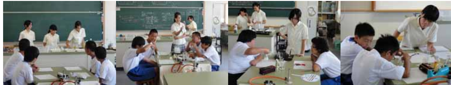
普段は授業を受ける立場の生徒たちですが、この日は先輩として立派に中学生を指導しました。

大崎上島中学校理科室において、サイエンス部生徒による中学校出前講座を実施しました。内容は、昨年度の広島県科学セミナーで学んだ実験を中学生向けにアレンジしたものです。オキシドール、うがい薬、片栗粉、炭酸飲料を用いて、3分計をつくりました。化学反応を利用して、3分で色が変わるようにチャレンジしました。また、その原理も説明しました。受講した中学生からは、「先輩方が親切に教えてくださったおかげで楽しかった」という感想が寄せられました。