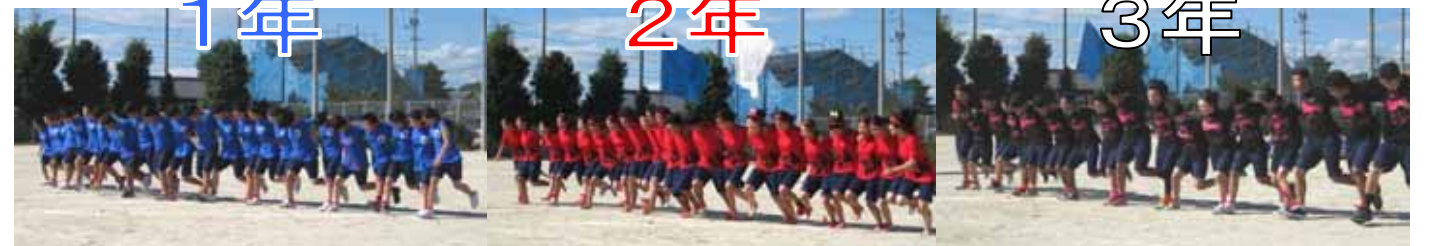
11 力を合わせて (人×脚)