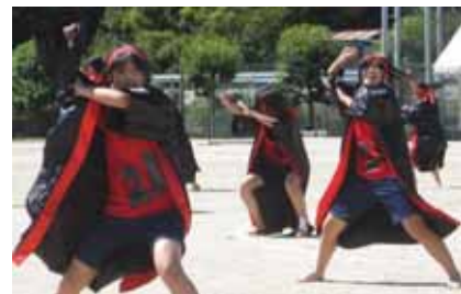
9 ソーラン踊り (2年生)