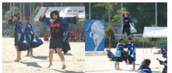
14 ソーラン踊り (3年生)