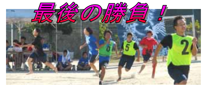
16 学年選抜リレー (決勝)