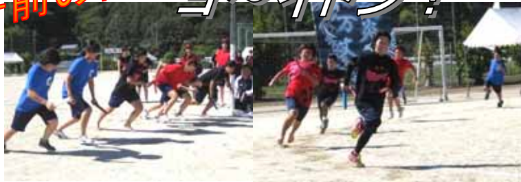
2 学年選抜リレー (予選)