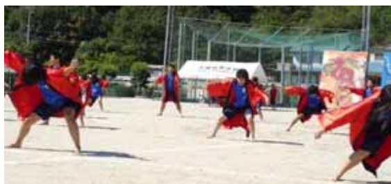
4 ソーラン踊り (1年生)