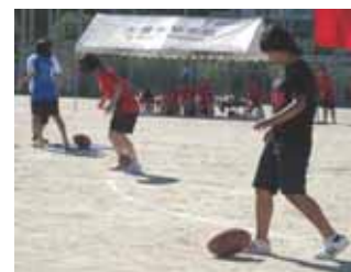
12 めざせワールドカップ