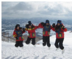
みんなでナイター！