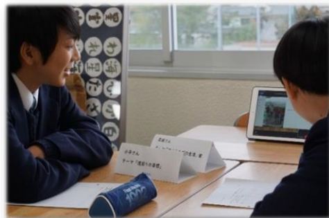
オンラインで大学生と話す1年生

グループは一回交代し、高校生たちは、合計4名の大学生とお話することができました。終始、楽しそうに大学生と高校生が交流している様子でした。授業後、高校生からは、「聞いた話を自分のことに生かしていきたい」「大学への興味が強くなった」「楽しかった!」といった声がありました。