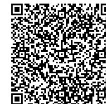
大崎海星高校ムービープロジェクト第3弾 「バーチャル学校見学」

動画作成グループは、大崎海星高校の魅力を動画で伝える「大崎海星高校動画プロジェクト」の第3弾として、「バーチャル学校見学ツアー」の動画を作成しました。参加した生徒たちは「自分たちで構図を考えたり編集したりして、楽しかった。次はストーリー性も考えながら、もっと賑やかな動画を撮ってみたい」と、すでに第4弾の作成に意欲を示していました。動画はQRコードからご覧いただけますので、ぜひご覧ください!