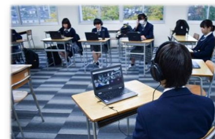
定期的に参加校同士でミーティングを行っています

このプロジェクトを通して、様々な地域で働く人の思いや情熱を知ることができ、自分たちの将来についてより深く考えられるのではないのでしょうか。『ひろしまの仕事図鑑』の完成にご期待ください!